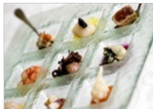
I ristoranti stellati dei Leading Hotels